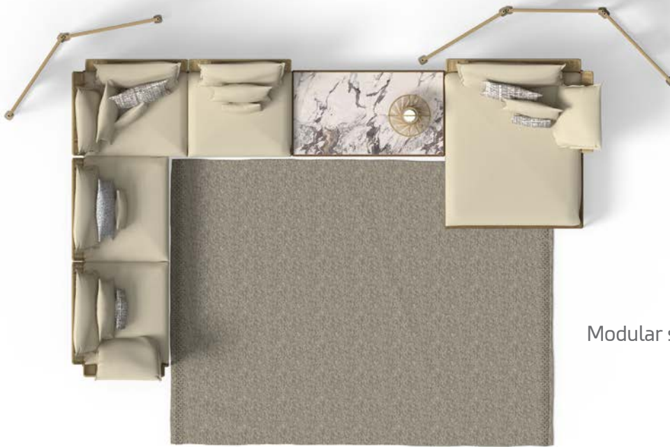
Modular sofas - Dimensions 545x340 cm